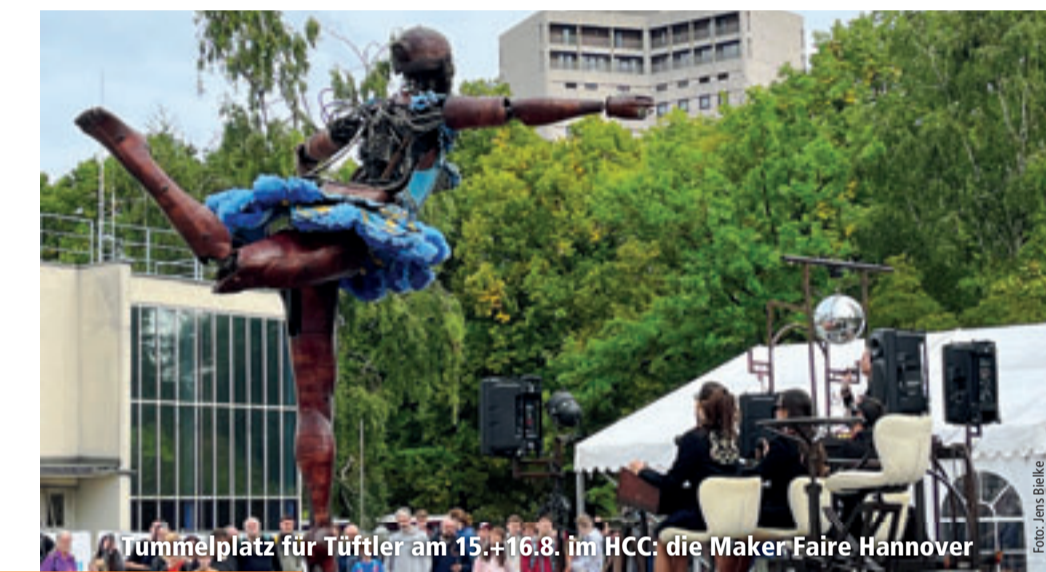
Tummelplatz für Tüftler am 15.+16.8. im HCC: die Maker Faire Hannover