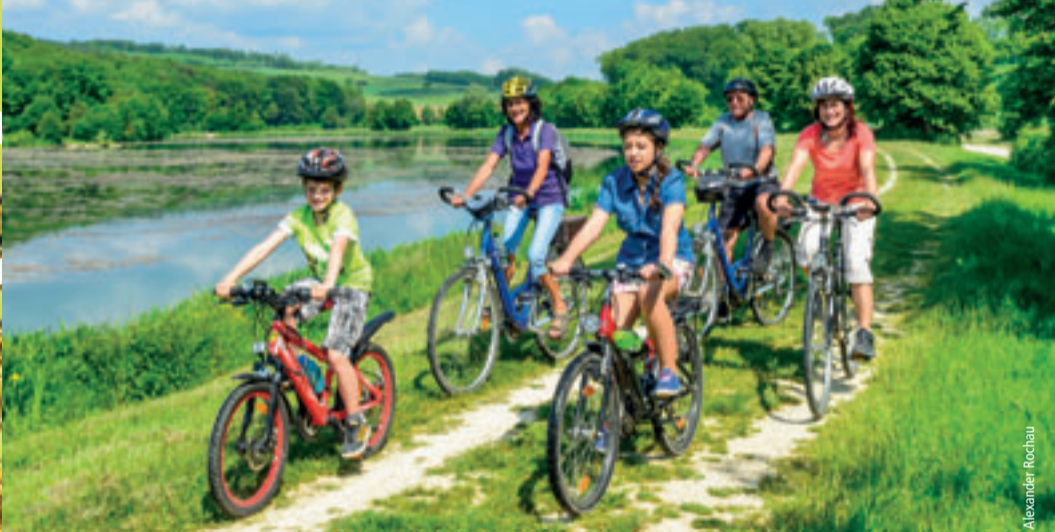
Klimaschonend: eine Radtour ins Grüne mit der Familie

Die Lust auf einen „Sommer vorm Balkon“ ist ungebrochen. Und hier knüpft unser Ausflugsposter 2026 an, das erneut für alle gedacht ist, die Staycation lieben. Ein „Urlaub daheim“ kann nämlich auch neue Blickwinkel auf die eigene Region, die eigene Stadt oder das eigene Dorf ermöglichen. Genießen Sie in diesem Sommer wieder die Welt vor Ihrer Haustür: in Wanderstiefeln oder in die Pedale tretend, neugierig durch Gärten schlendern oder sich sportlich im Freien betätigend, hungrig und durstig in lauschige Biergärten einkehrend, bei einem Kurztrip in die Region und das Land, auf einer der vielen Open Air-Veranstaltungen oder, falls es die Sonne zu gut mit uns meint, bei einem Ausstellungsbummel durch ein klimatisiertes Museum. Der Fantasie sind keine Grenzen gesetzt. Wir wünschen Ihnen viel Spaß bei Ihrem „Urlaub daheim“!