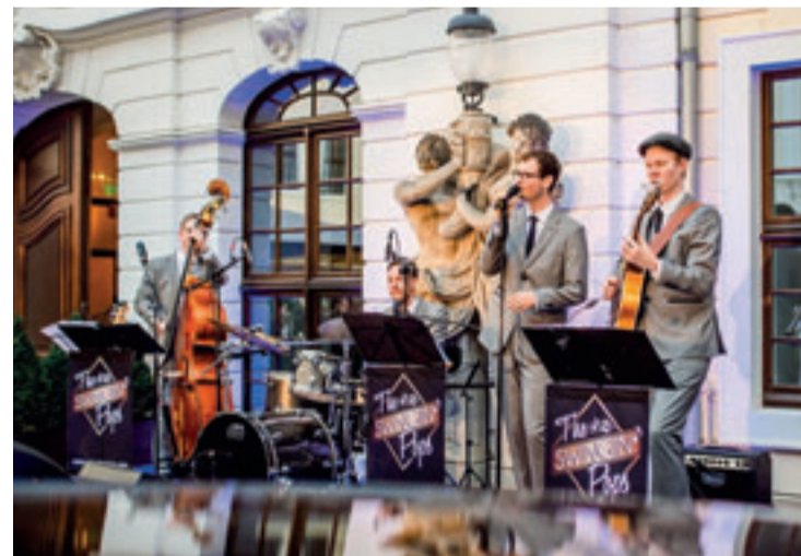
The Swingin' Pops spielen am 1.8. im Pfarrgarten Seelze

Sommer, Sonne, Kultur pur: Der 28. Kultursommer der Region Hannover und der Stiftung Kulturregion Hannover zeigt auch in diesem Jahr wieder, wie vielfältig, verbindend und farbenfroh Kultur sein kann. Ein buntes Programm bietet vom 1. Juli bis zum 30. August die Möglichkeit, atmosphärische Orte und kulturelle Schätze in der Region Hannover zu entdecken. 27 Veranstaltungen lohnen einen Besuch in Parks, Gärten, Scheunen, Schwimmbädern, Kirchen oder Schlössern. Veranstaltungsorte sind Barsinghausen, Bredenbeck, Brelingen, Garbsen, Gehrdens, Hannover-Kleefeld, Hannover-List, Hannover-Ricklingen, Hannover-Stöcken, Laatzen, Neustadt am Rübenberge, Poggenhagen, Ronnenberg, Springe, Seelze, Wedemark und Wunstorf. www.kultursommer-region-hannover.de