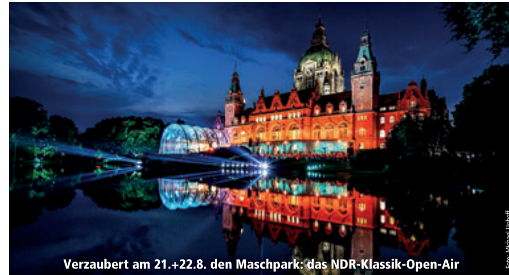
Verzaubert am 21.+22.8. den Maschpark: das NDR-Klassik-Open-Air