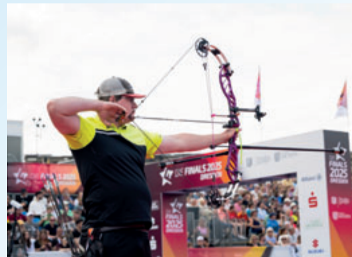
Die Besten im Bogensport werden am Neuen Rathaus ermittelt

„Die Finals“ sind ein seit 2019 annähernd jährlich im Sommer stattfindendes Multisportevent, bei dem die Deutschen Meisterschaften in verschiedenen Sportarten zeitgleich an einem oder mehreren Orten ausgetragen werden. 2026 ist Hannover der Austragungsort dieser nationalen „Mini-Olympia“. Vom 23. bis 26.7. werden insgesamt 143 Deutsche Meistertitel in 24 Spitzensportarten vergeben, darunter im Gerätturnen, Rhythmische Sportgymnastik, Gewichtheben, Rudern, Kanu, Triathlon, 3x3-Basketball, Speedklettern, Segeln, Windsurfen und Bogensport. Austragungsorte sind: das Erika-Fisch-Stadion, der Maschsee, das Gelände rund um das Neue Rathaus, der Opernplatz, das Stadionbad, die ZAG-Arena, die Swiss Life Hall und das Steinhuder Meer. Der Großteil der Wettkämpfe kann kostenfrei besucht werden. www.diefinals.de