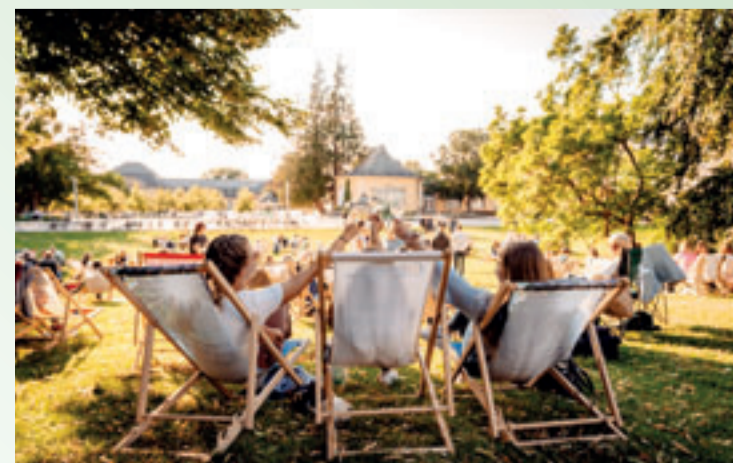
Die LAGA bringt Gartenidylle nach Bad Nenndorf

Noch bis zum 18. Oktober lädt die achte Landesgartenschau (LAGA) nach Bad Nenndorf ein - vor den Toren Hannovers und mitten in einer historischen Kurparkanlage, die sich zwischen Stadt und Landschaft öffnet. Auf rund 34 Hektar verbindet die Schau Gartenkunst, Bildung, Kultur und Freizeit zu einem Erlebnis, das alle Generationen ansprechen möchte. Das denkmalgeschützte Gelände rund um die einzigartige Süntelbuchental-See bildet das grüne Herz der LAGA. Neue Themengärten, kreative Wissensstationen, Ruheorte und florale Inszenierungen sollen Raum für Inspiration und Erholung schaffen. Die Gestaltung nimmt Rücksicht auf Bestehendes, setzt aber bewusst neue Impulse - in Richtung Nachhaltigkeit, Klimaresilienz und Lebensfreude. www.landesgartenschau-badnenndorf.de