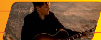
// MICHAEL PATRICK KELLY 21.08.2026 • Waldbühne Northeim