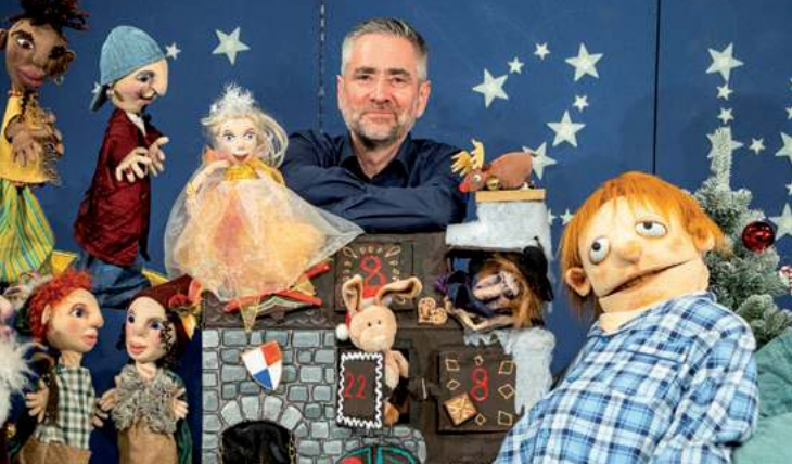
Willi und der magische Adventskalender Figurentheaterhaus, 1.-3.12.