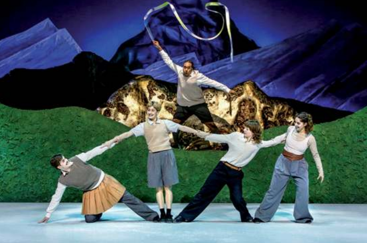
Die Schneekönigin Schauspielhaus, 21.12.