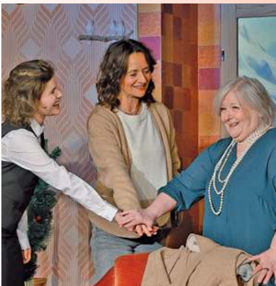
Die Komödie Drei Frauen im Schnee sorgt noch bis zum 7.2.26 für viele Lacher im Neuen Theater .