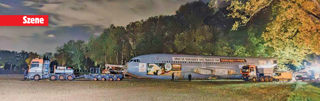
Platz da, hier kommt der Airbus A310 für den Serengeti Park!

rant gemeinsam mit seinen Kindern zu eröffnen und damit eine neue Ära der Familiengeschichte zu schreiben. Leider konnte er diesen Moment nicht mehr erleben. Im Oktober 2024 ist er verstorben. Nun erfüllen seine Kinder diesen Herzenswunsch und eröffnen das Restaurant für ihn und in seinem Namen. Inmitten der Natur, im Schützenhaus in der Wilkenburger Straße 30, erwartet die Gäste ein stilvolles Ambiente aus natürlichen Materialien, modernen Designelementen und einer großzügigen Winterterrasse, die das ganze Jahr über ein besonderes Erlebnis bietet. Das Farbkonzept orientiert sich an Cellos Lieblingsfarbe Rot, die Wärme, Leidenschaft und Lebensfreude symbolisiert. Kulinarisch setzt CELLO auf eine internationale Küche mit einem besonderen Fokus auf orientalische Spezialitäten, neu interpretiert und modern präsentiert. Alle Gerichte werden nach den Grundsätzen der Halal-Küche zubereitet: authentisch, hochwertig und mit Liebe zum Detail. Hinter dem Projekt steht ein junges, dynamisches Team der dritten Unternehmergeneration, das mit Energie, Innovationsgeist und großem Respekt vor dem Familienerbe antritt. --- Mehr Ideen, mehr Teamgeist, mehr Gründungsenergie: Das leanlab 2025 auf dem Conti-Campus der Leibniz Universität Hannover war ein voller Erfolg. Gemeinsam veranstal-