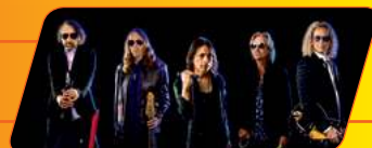
// FOREIGNER 12.06.2026 • Waldbühne Northeim