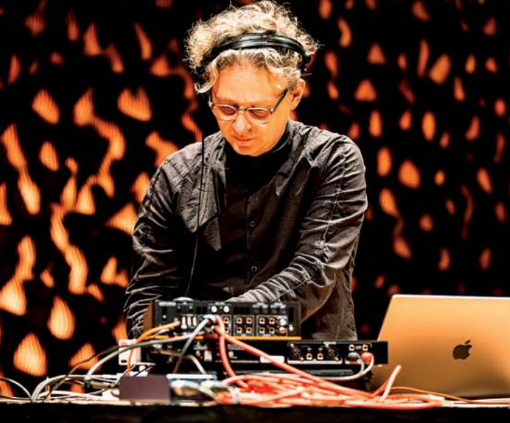
Damian Marhulets Feinkost Lampe, 11.12.