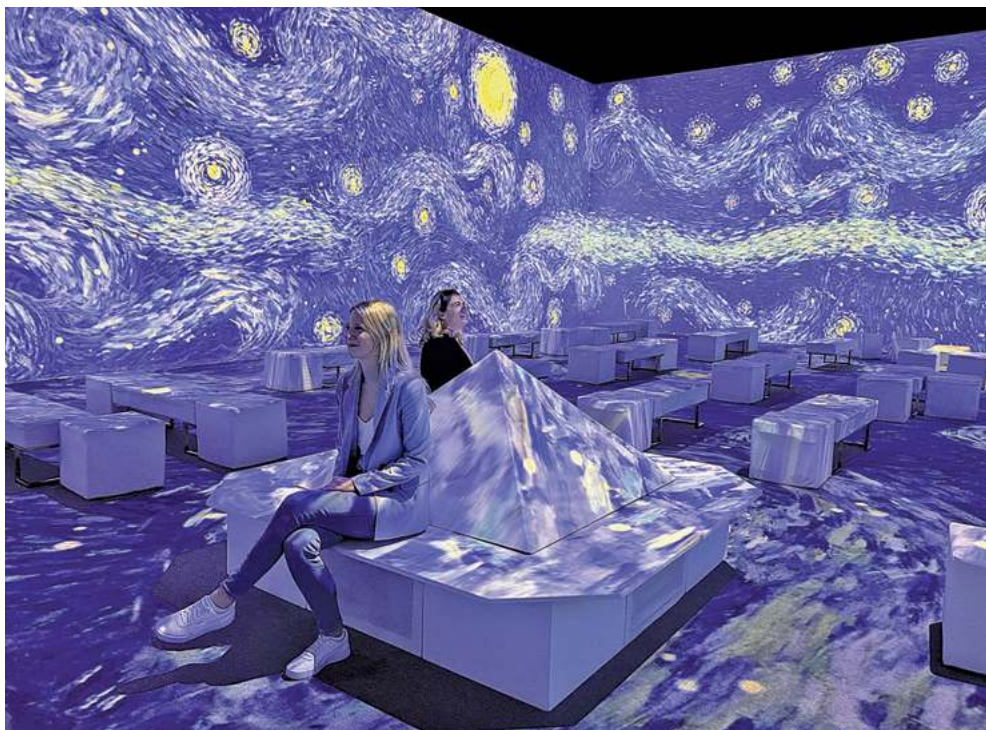
Blick in die Van Gogh-Ausstellung

magaScene: Wenn am 1. März 2026 die Van Gogh-Ausstellung schließt, gibt es schon Pläne für eine Nachfolgegegeschichte?