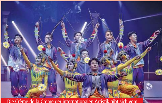
Die Crème de la Crème der internationalen Artistik gibt sich vom 18.12. bis 4.1. ein Stelldichein beim 7. Weihnachtscircus auf dem Schützenplatz . Mit dabei ist The Acrobatic Troupe of Dezhou City .

Comedy, Musik, Tanz, Schauspielerei: Shows von Teddy Teclebrhan sind außergewöhnliche Happenings, nachzuprüfen am 12. und 13.12. in der ZAG Arena .