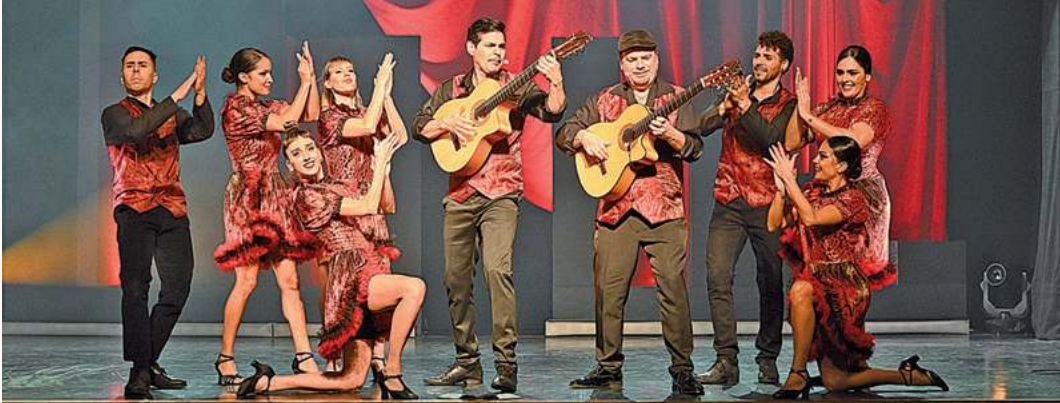
Das diesjährige GOP Wintervarieté Sentimientos entfacht noch bis zum 18.1. das Feuer Spaniens in der Orangerie Herrenhausen .