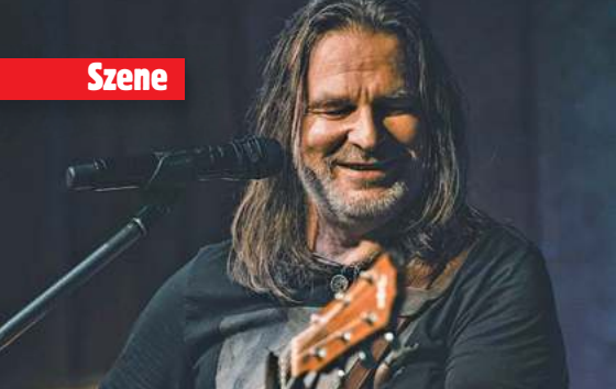
Ray Wilson und weitere Top-Künstler spielen 2026 auf der Insel Wilhelmstein