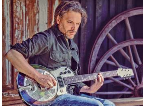
Bald kommt ein neues Ingvay-Album