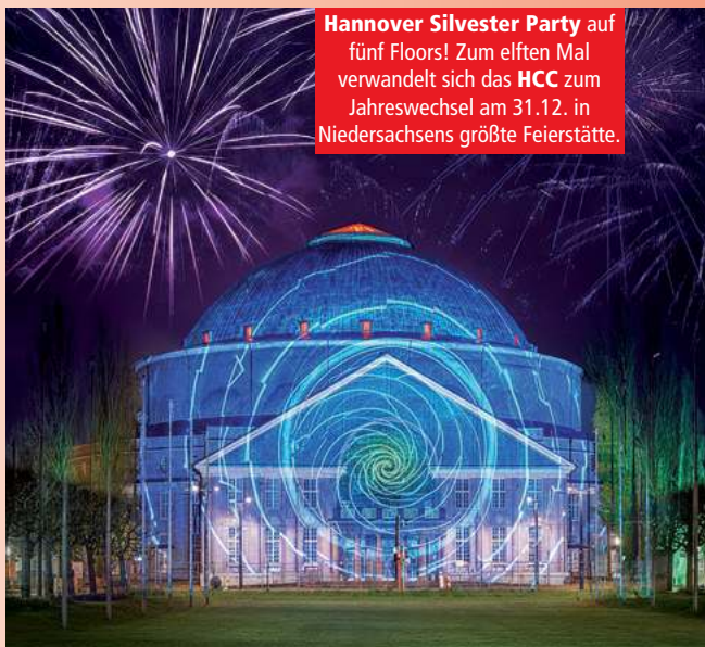
Hannover Silvester Party auf fünf Floors! Zum elften Mal verwandelt sich das HCC zum Jahreswechsel am 31.12. in Niedersachsens größte Feierstätte.